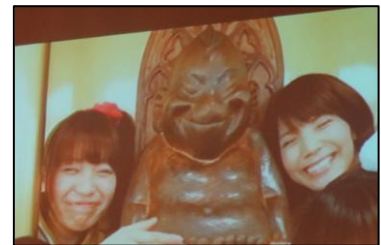
大阪から ご当地アイドル も登場！ ただし スクリーンの中。