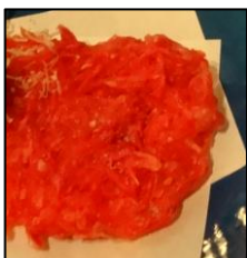
紅しょうがの天ぷら