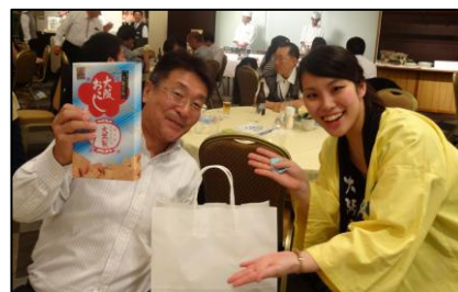
景品を引当てて喜ぶ 顔！ 顔！ 顔！ はて？どこかでお見かけ したような。 思いがけない出会いも ありました。