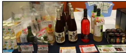
梅酒のラインナップ