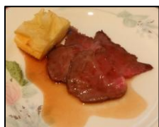
梅ビーフロースト