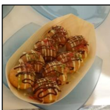
一見たこ焼き 実はシュークリーム(塗りたくっているのはソースではなく、チョコレート)