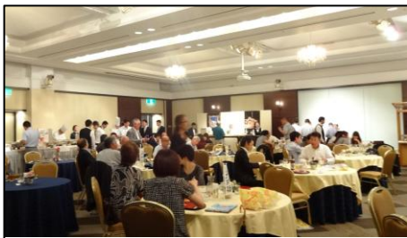
まずは飲んで食べて！ バイキング形式。大阪名物に舌づつみ。