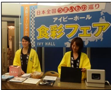
笑顔の受付嬢 料金を支払って抽選券を受け取ります。