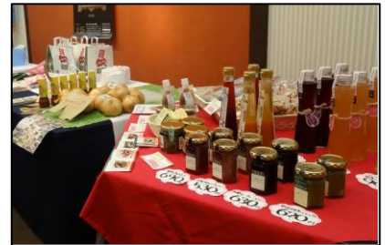
ずらり並んだ特産品