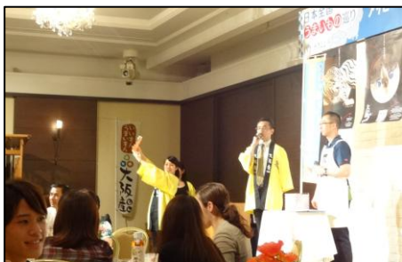
お待ちかね。抽選会が始まります。