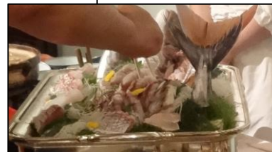
お造り盛り合わせ (鯛の姿造り)